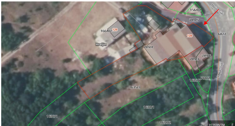
Slika: Ortofoto snimak područja nekretnina

Lokacija: Predmetne nekretnine nalaze se u Primorsko-goranskoj županiji, u katastarskoj općini Hreljin. Katastarske čestice br. 789/4 i 1636/1 k.o. Hreljin nalaze se dijelom unutar i izvan granica građevinskog područja naselja